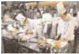
Schaukochen als einer der Höhepunkte bei der HoGa Serviceteil