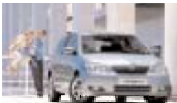
Toyota Corolla ist und bleibt ein Dauerrenner Seite 22